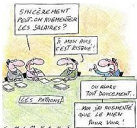
Résumé des demandes CGT d'augmentations individuelles 2019 hors enveloppe égalité professionnelle