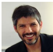
Ph.CHARO Elu CE